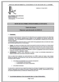
NDO N°01/2016 Tuerie de masse