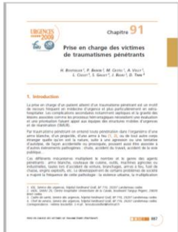
Prise en charge de victimes de traumatismes pénétrants