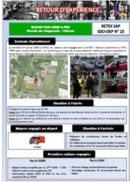
RETEX SAP GSO-DEP N°23 Blessé par arme à feu à Valence